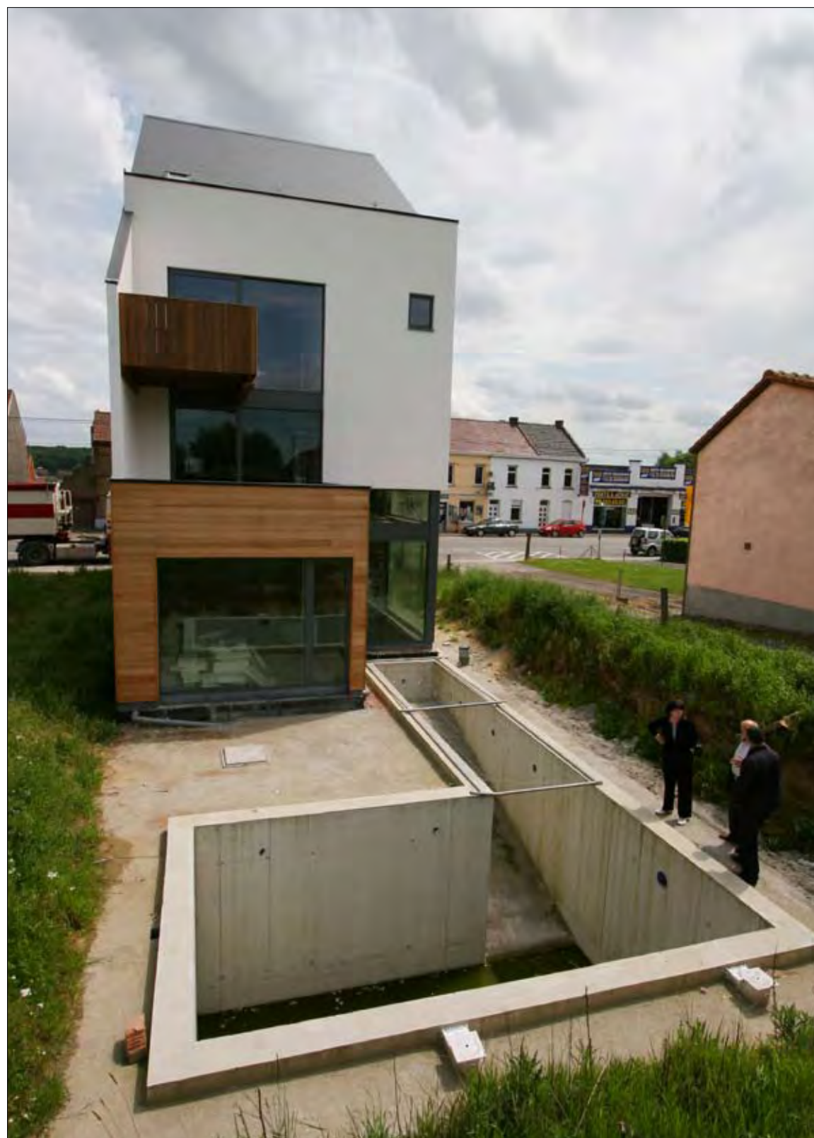
Habitation à Tubize

Quels sont les enjeux principaux pour l'architecture aujourd'hui ?