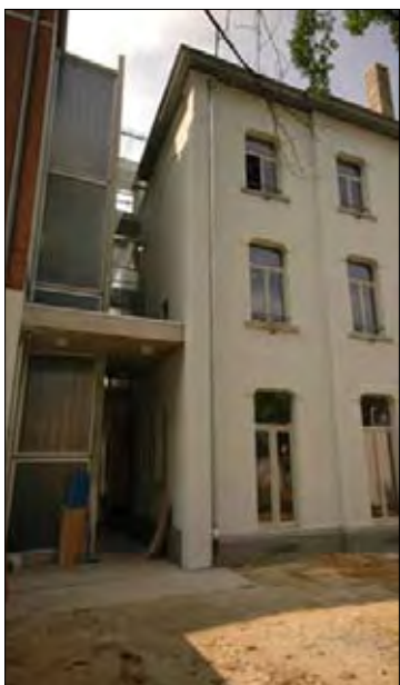
Extension rue de l'Etoile à Namur.

La question ressemble à la définition de la profession de l'architecte en Belgique. A ça, il faut rajouter la complexité