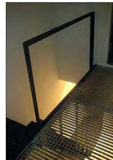
Habitation 23 rue Steyls à Bruxelles

Je pense que, à l'instar du médecin, l'architecte va devoir se spécialiser. L'architecture est vaste et couvre de nombreux domaines de connaissances. On peut s'intéresser à tout mais je pense qu'il faut bien s'entourer afin d'aboutir à des projets de qualité. Dans certains pays, c'est déjà le cas. En Belgique, certains bureaux travaillent de la sorte mais ce n'est pas la majorité.