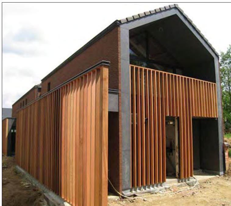
Pharmacie à Chaumont-Gistoux

La lumière naturelle baigne chaque pièce en créant de subtiles nuances qui enrichissent